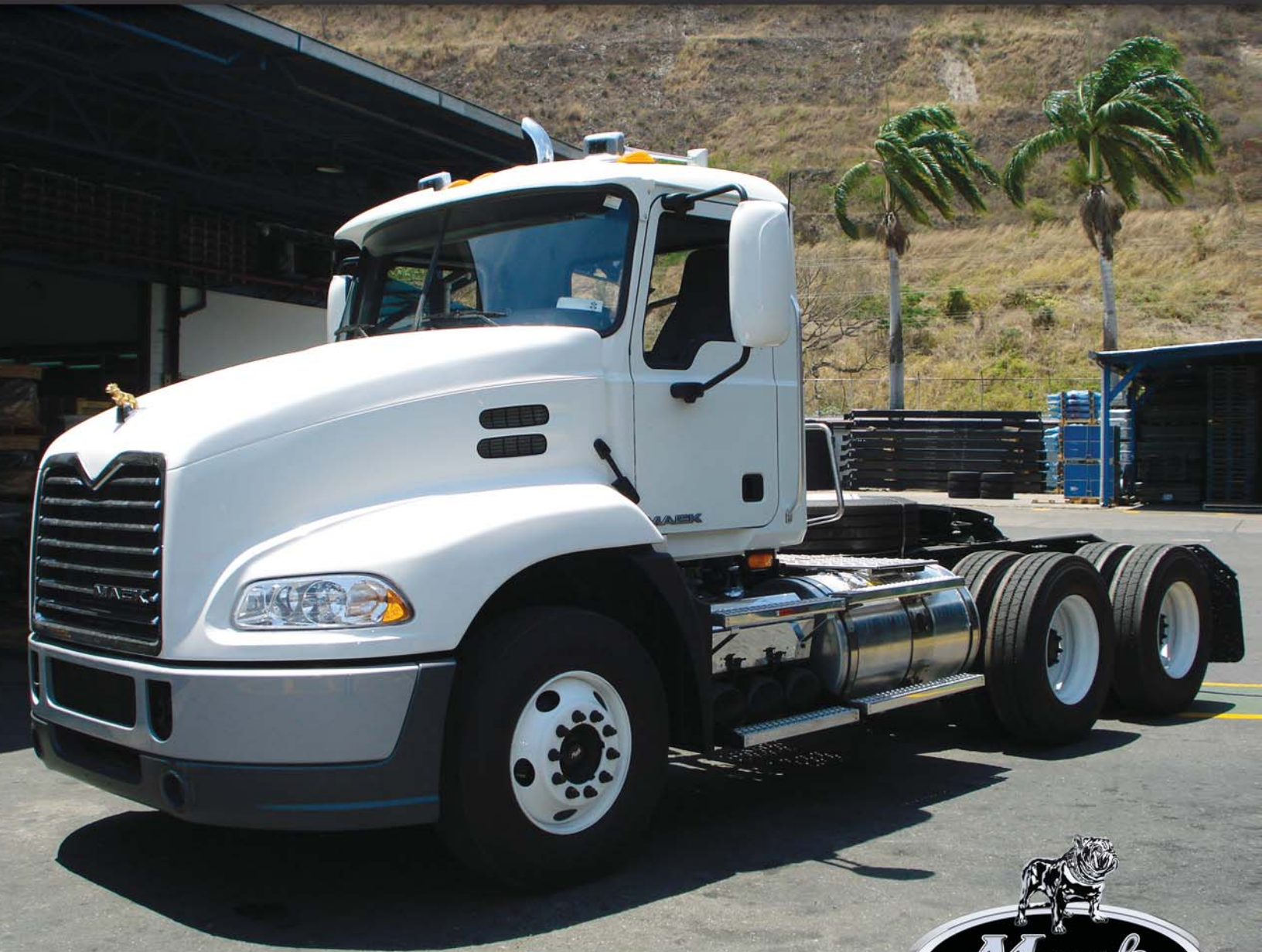
Especificaciones Standard (mm)